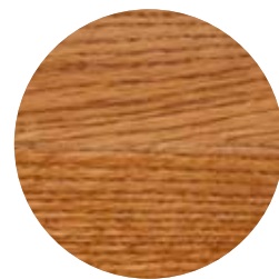
3143 Cognac transparent dekorvax