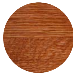
3138 Mahogny transparent dekorvax