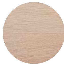
3115 Ljusgrå täckande dekorvax