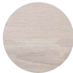
3112 Vit täckande dekorvax

Trägolv är inga konstigheter. De är naturliga, levande, lätta att förändra och kan fås i de flesta utföranden. Mjukt eller hårt, lackat, laserat, mörkt, ljusst... för att inte tala om alla spännande infärgningar du enkelt kan göra med Osmos dekorvaxer. Det är bara din fantasi och skaparlust som sätter gränser. Hur vill du att ditt golv ska bli?