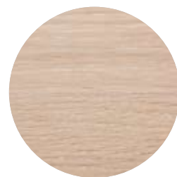
3111 Vit transparent dekorvax

Forbo Flooring ingår i den schweiziska Forbokoncernen och erbjuder ett komplett sortiment av golvprodukter för såväl företag som privatpersoner. Våra högkvalitativa linoleum, vinyl och parkettgolv förenar funktion, färg och design, vilket möjliggör helhetslösningar för golv i alla miljöer.