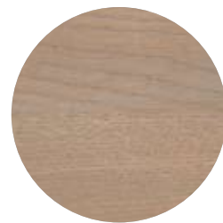
3116 Lera täckande dekorvax