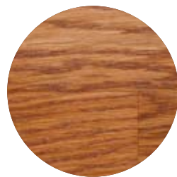
3137 Körsbär transparent dekorvax