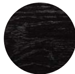
5290 Becksvalt täckande dekorvax