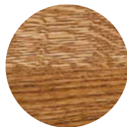
3168 Antik Ek transparent dekorvax