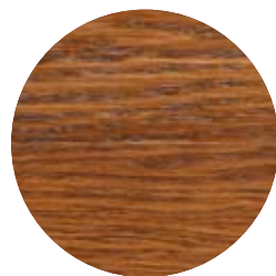
3165 Brun täckande dekorvax